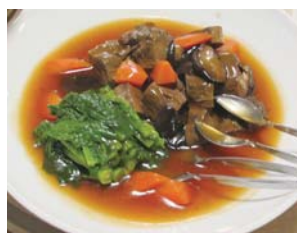
牛タンの柔らか煮菜の花添え