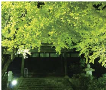
ライトアップされた境内

※稲沢市祖父江町は、江戸時代から続く銀杏の名産地。生産者、地元商店街、自治体が一体となって、銀杏と、その加工品やメニューを開発しPRしています。