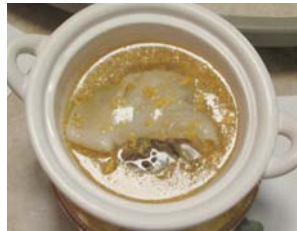
ふかひれ満載 海胆風味ソース