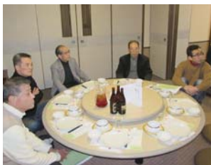
解説を聞く参加者