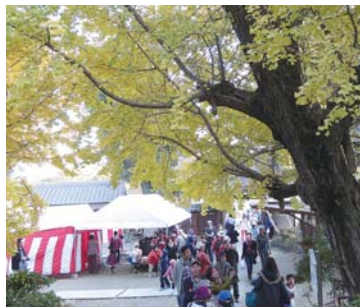
黄葉並木を散策する人達