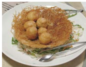
極上紋甲烏賊団子