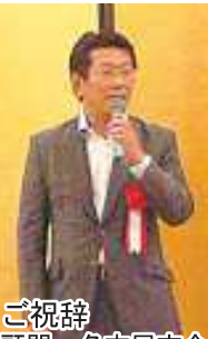
ご祝辞 顧問 名古屋市会 ふじた和秀議員

伊藤理事による開会の辞「日本人の食べる中華料理は日本人が作るのが一番。若者たちを取り込み、日本における中華料理という文化のグレードをあげていきましょう」に続き、