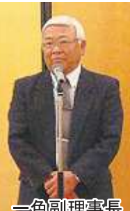
一色副理事長 閉会の辞