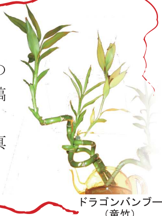
ドラゴンバンブー (竜竹)