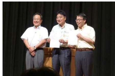
第63回愛知県・名古屋市推進大会の様子 寺脇一峰検事正(左) 河村たかし名古屋市長(中) 大村秀章愛知県知事(右)

当組合も、この趣旨に賛同し、 広報活動等に協力しています。 ***** この運動について詳しく知り たい方は *****