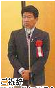
ご祝辞 顧問 愛知県議会 寺西睦議員