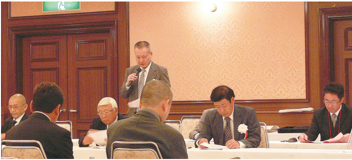
委員長による事業報告

[7] 3月4日 西部地区役員料理講習会・経営研修会が大阪市で開催され、愛知県から9名が出席した。