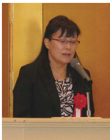
名古屋市長よりご祝辞 (代読 村松様)