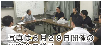
写真は6月29日開催の研究会の様子

次回(8月3日)は午後10時30分より開催します。参加ご希望の方はお事務局までご連絡下さい。