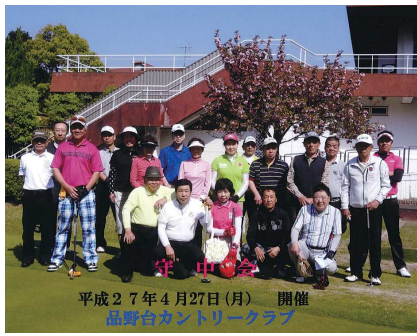
平成27年4月27日(月) 開催 品野台カントリークラブ

守山支部では、支部総会と家族交流会を同日開催しました。家族交流会(守中会ゴルフコンペ)は、品野台カントリークラブで開催され20名が参加、快晴のもと仕事を忘れて楽しみました。このあと猿投温泉・金泉閣にて、午後6時より総会を開催。オブザーバーとして一色副理事長に同席していただきました。組合活動と決算報告の後、来期予算や展望