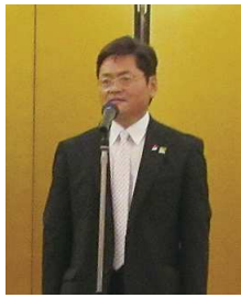
日比野副理事長による開会の辞

組合員、ご来賓、商社の方々が集い、互いの近況報告、情報交換など和やかなながらも有益な懇親会となり、最後は一色副理事長の閉会の辞で散会しました。