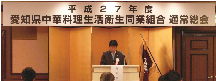
神野新理事長が議長となり議事が進行

さる6月3日、平成27年度の愛知県中華料理生活衛生同業組合通常総会が開催されました。