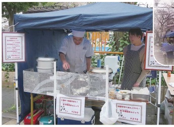
小寒い雨の中、熱々の中華メニューは大好評で完売しました。