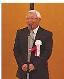
一色副理事長による閉会の辞